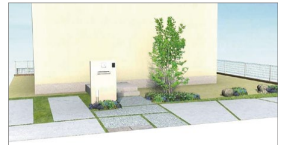
●46街区北側法面イメージ